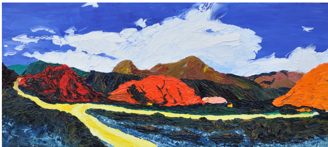
"Camino de Purmamarca" 30x60cm 2018